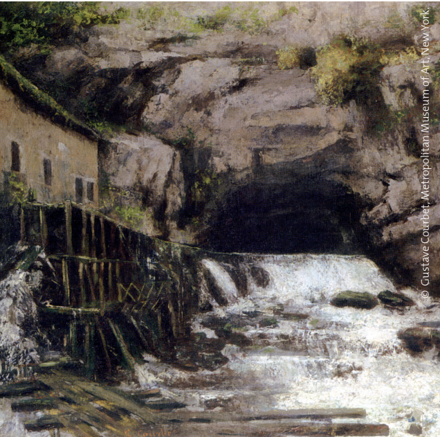
La Source de la Loue, 1864.

Le bâtiment et ses coursiers, encore présents au temps de Gustave Courbet, sont détruits en 1926.