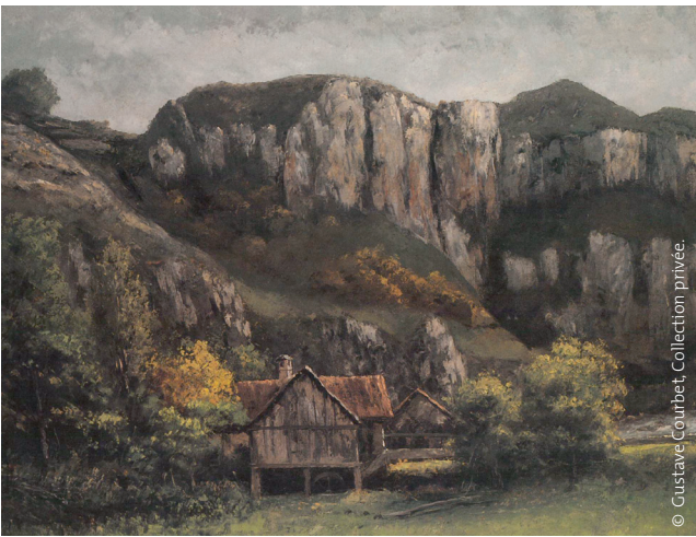
Le Moulin, 1872.

À droite du panorama de Renédale, la cuvette que forme le synclinal de Syratu est facilement observable avec les rochers étagés et peints par Gustave Courbet. Partie intégrante des œuvres, le magnifique massif de calcaire du jurassique moyen (170 millions d'années) est dénommé Rocher de la Grande Baume.