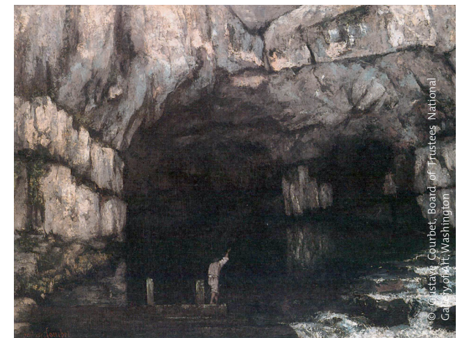
La Source de la Loue, 1864.

Sur cette œuvre apparaît une série d'indices qui nous explique le fonctionnement même du moulin et des canaux.